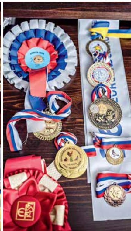
▲ Jeho chovateľské úsilie mu prinieslo i ovocie – desiatky ocenení z rôznych výstav.

lovstva je predsa len rozdiel. Ľudia žijúci v Česku na vidieku sa skôr nadchnú pre nejakú myšlienku a majú tam oveľa lepšie zázemie.